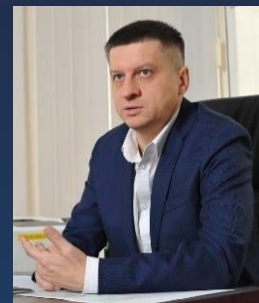
А.В. Михайлик Вице-президент АО «Российский экспортный центр»