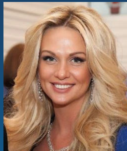
В.П. Лопырева Российская телеведущая, блогер