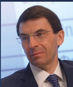
И.О. Щёголев Полномочный представитель Президента Российской Федерации в Центральном федеральном округе