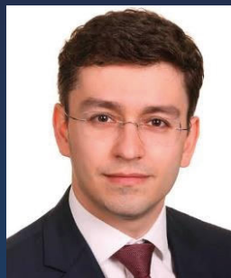
А.К. Ниязметов Заместитель полномочного представителя Президента Российской Федерации в Центральном федеральном округе