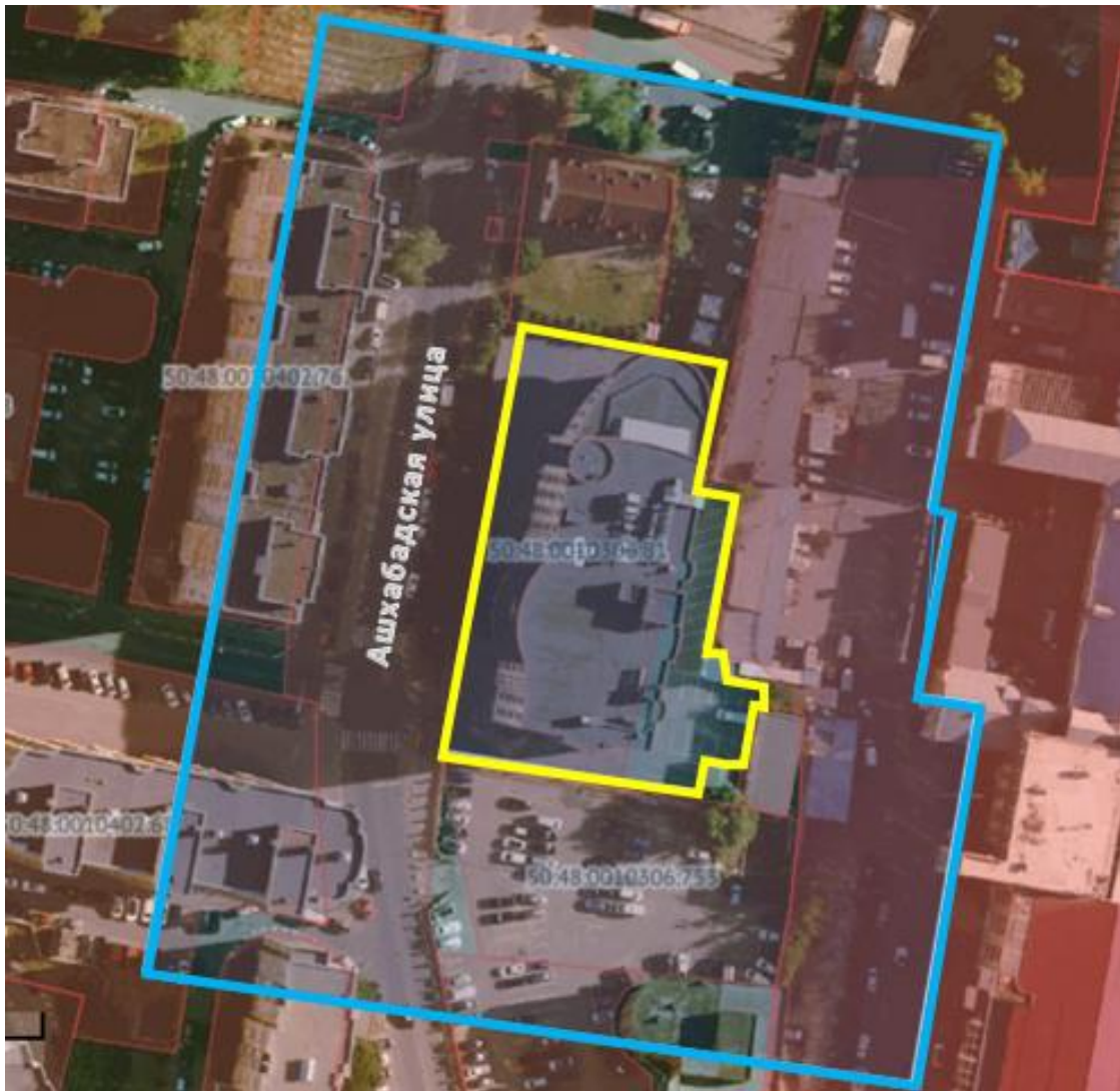
Схема границ подготовки проекта межевания территории