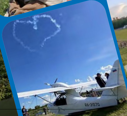
@MYSKYMSK Спасибо за чудесные впечатления