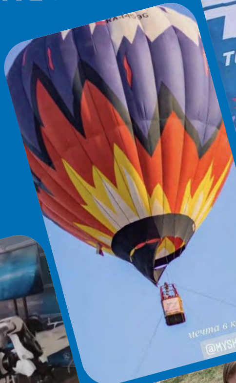
мечта в копилку @MYSKYMSK