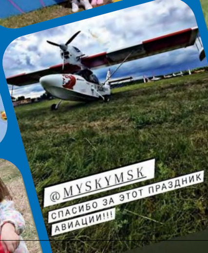
@MYSKYMSK СПАСИБО ЗА ЭТОТ ПРАЗДНИК АВИАЦИИ!!!