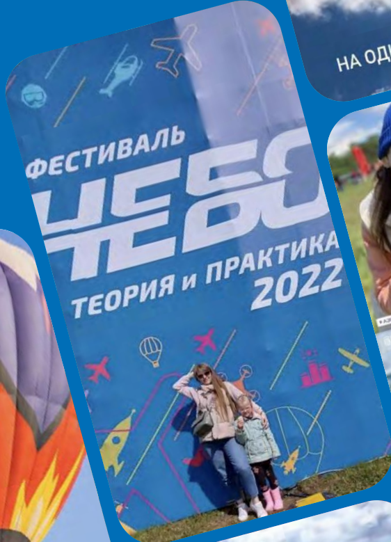
НА ОДНОМ ДЫХАНИИ 🍦