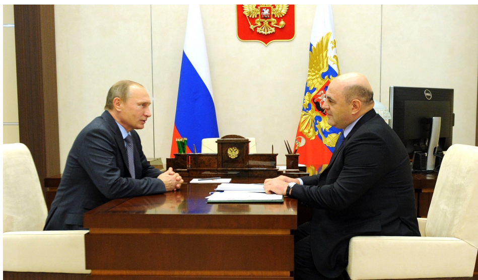
Президент России В.Путин и руководитель ФНС России М.Мишустин. 20 ноября 2015г.