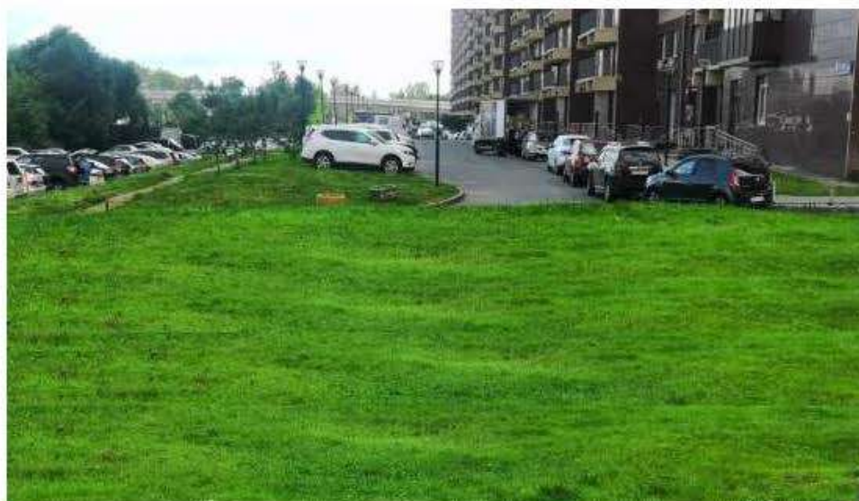
Фото № 2 Дата съемки 29.07.2020, время съемки 09 часов 05 мин.

Фото № 1 Дата съемки 29.07.2020, время съемки 09 часов 00 мин.