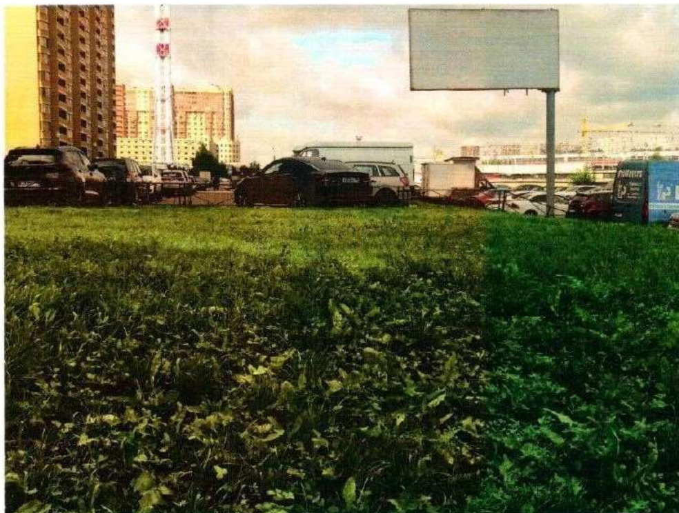
Фото № 4 Дата съемки 29.07.2020, время съемки 09 часов 15 мин