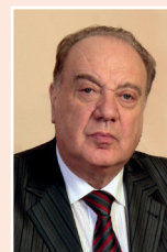
Бутковский Вячеслав Аронович Президент Международной промышленной академии