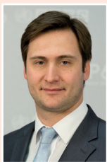
Салагай Олег Олегович Директор Департа- мента обществен- ного здоровья и коммуникаций Минздрава России