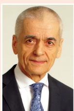
Онищенко Геннадий Григорьевич Первый заместитель пред- седателя Комитета Госу- дарственной Думы ФС РФ по образованию и науке, академик РАН