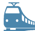
Железнодорожные пути необщего пользования